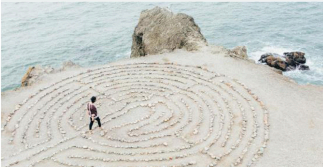
3. Slik håndterer vi risikoområdene våre.